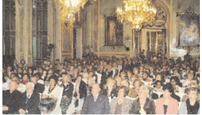
Imagen de un abarrotado Salón Real en el transcurso de la presentación del libro de la Condesa de Latores.