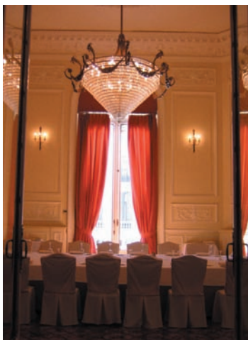
Dos imágenes del renovado Salón Alcalá.