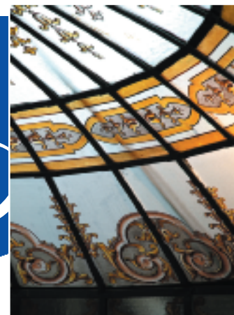
Detalle vitriera Salón Real.

"Tré a cualquier sitio, siempre y cuando sea hacia adelante" (Dr. Livingstone)