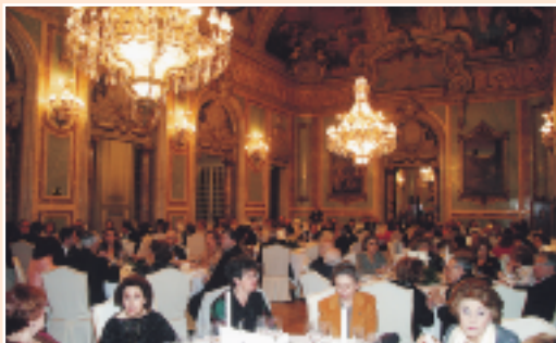
El Salón Real se llena siempre, en especial, en los conciertos.