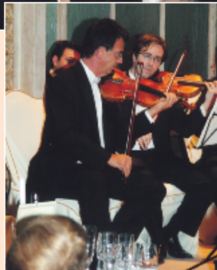
Algunos de los violines de la orquesta son piezas de gran valor histórico.