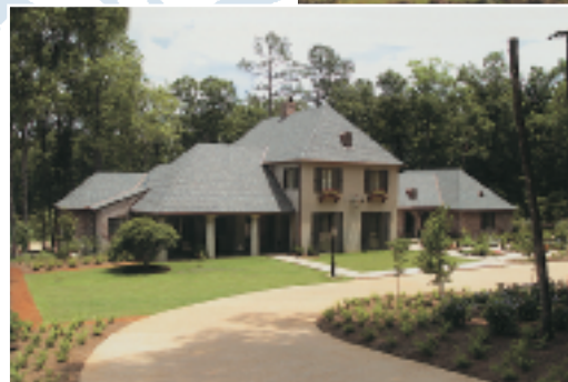
Casino de Madrid

El Club cuenta con un campo de golf de 18 hoyos.