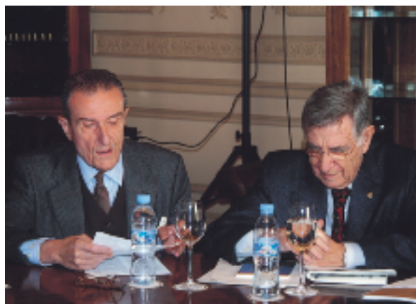
Tertulia Literaria "Natalio Rivas".

Uno de los aspectos que caracteriza nuestra Sociedad, es la posibilidad de acudir a reuniones periódicas en las que se tratan temas de interés para socios que tienen gustos e inquietudes afines. Son las tradicionales tertulias que cuentan cada vez, con más capacidad de convocatoria y a las que acuden invitados de prestigio para compartir con los socios sus saberes y experiencias.