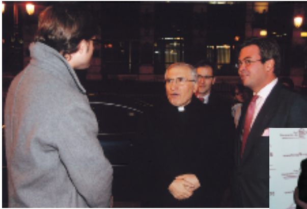
Foro Generación del 78 es una de las más activas tertulias del Casino. En las imágenes con uno de sus invitados; en esta ocasión con el Cardenal-Arzbispo Rouco Varela.