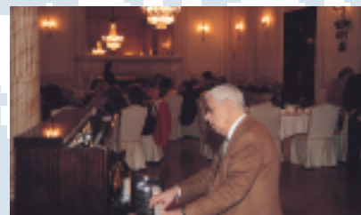
Tertulia de Señoras Socias. Es la cita obligada de cada mes para las damas casinistas. Té y música en vivo son algunos de sus atractivos.