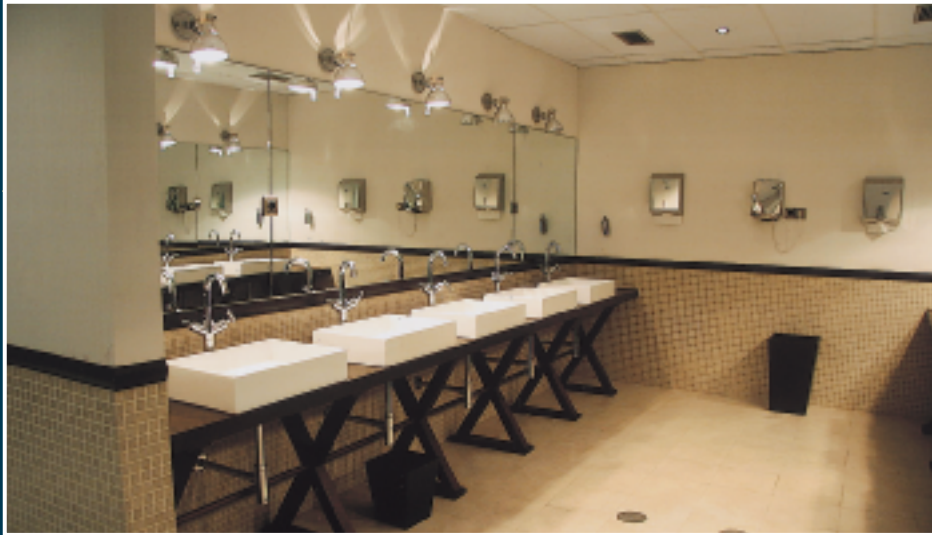
Las mejoras en el campo son más que evidentes, no sólo en cuanto a mantenimiento en general, si no en zonas concretas como los vestuarios o el campo de prácticas