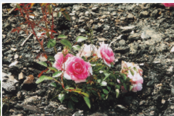
La llegada de la primavera es un espectáculo especialmente bello en el campo de Retamares. Nuestra visita, a finales de mayo, se vio acompañada por cientos de flores de vivos colores, recios arbustos y un verde que pocas veces podemos ver en el paisaje madrileño. El buen trabajo de los jardineros del Casino Club de Golf Retamares queda patente en este grupo de imágenes.