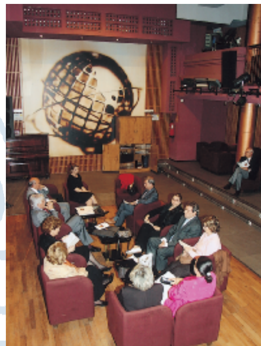
Imagen del emotivo homenaje que la Tertulia Musical rindió a tres tertulianos recientemente fallecidos.

El Casino de Madrid también cuenta con una Tertulia Marinera, que sigue congregando a numerosos socios en cada una de sus convocatorias.