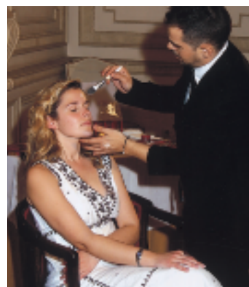
En una de las reuniones de las Señoras Socias, se dieron a conocer las últimas tendencias de maquillaje de la casa francesa Clarins.

Los casinistas más jóvenes siguen celebrando con éxito sus citas semanales con destacadas personali-