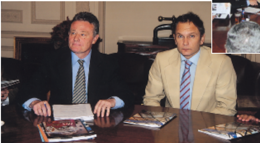
Dos imágenes de la Tertulia Taurina que contó con la visita de Julio Aparicio.