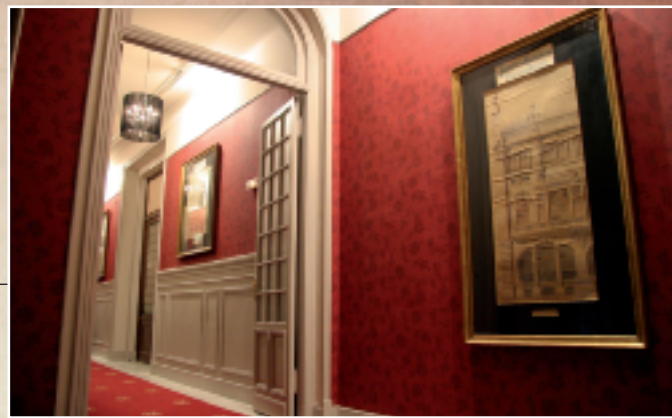
Lino gris, moqueta y papel burdeos, zócalo y puertas grises... una combinación muy acertada.