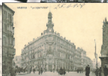
Casino de Madrid