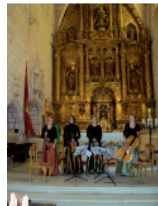
Cuarteto de cuerda de Nidaros.

Desde estas páginas damos la bienvenida a una nueva tertulia, que inició su andadura el 21 de noviembre, según su propia comunicación. Se trata de la Tertulia de los Amigos de las Artes, del Casino de Madrid, en la que se hablará genéricamente de música, pintura, escultura, cine y teatro.