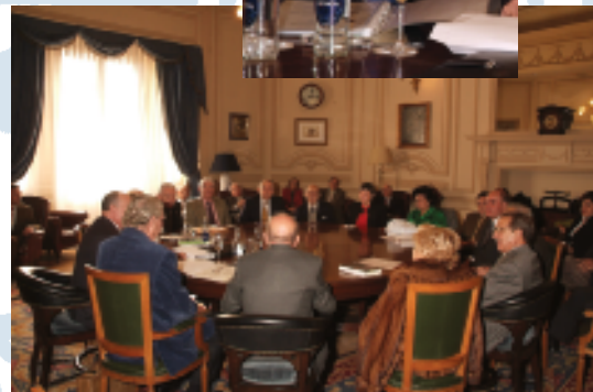
Casino de Madrid