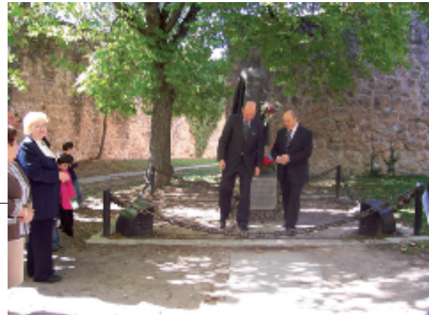
Imágenes de la visita de la Tertulia Musical a la ciudad burgalesa de Covarrubias.

venes Europeos. Tres de sus miembros viajaron a Berlín, donde pudieron compartir experiencias con otros jóvenes de diferentes nacionalidades europeas. En esta academia de verano, los jóvenes tienen la oportunidad de exponer sus ideas y debatir acerca del proyecto común que debe ser la Unión Europea. Durante una semana de trabajo e intercambio de experiencias analizaron junto a prestigiosos políticos, empresarios y personalidades del mundo académico y las relaciones internacionales, lo que debería ser el futuro de la UE.