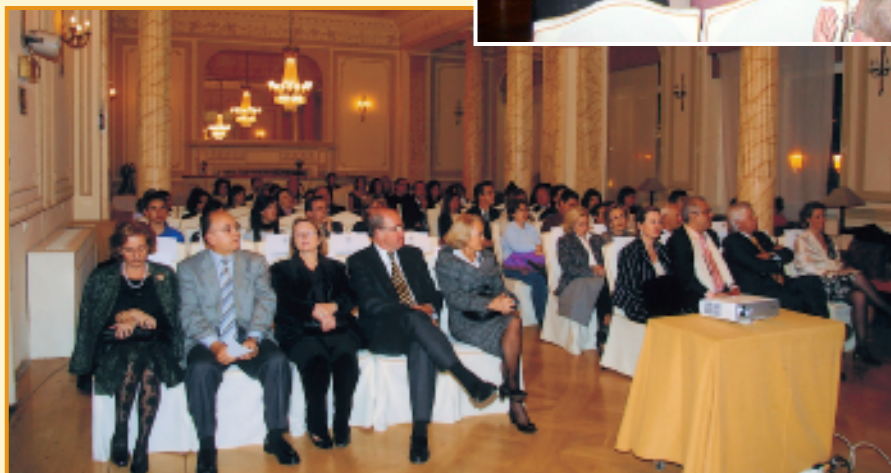
El concierto tuvo lugar en el Salón La Glorieta.