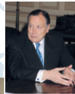
La Tertulia Taurina contó con la visita de José María Álvarez del Manzano.