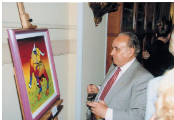
Dos imágenes de la inauguración de la muestra celebrada el 4 de junio.

Del 4 al 16 de junio, la Planta Conde de Malladas del Casino de Madrid acogió la muestra de pintura y fotografía de motivos taurinos. Un año más, coincidiendo con la Feria de San Isidro y los XIV Premios Taurinos, el Casino rindió homenaje al mundo del toro de la mano de 17 artistas.