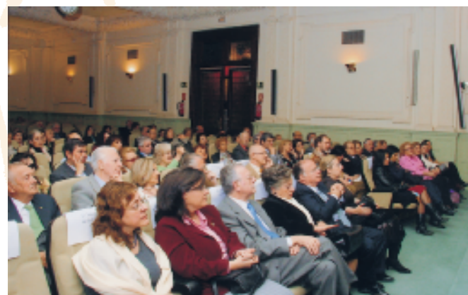
Casino de Madrid

¿Qué puede aportar la vida y la obra de Julián Juderías a la sociedad del siglo XXI? Nos aporta un elemento de objetividad, de actualidad, las Leyendas Negras preparan el delito, deshumanizan a las víctimas... (...) Tenemos el deber de luchar contra las Leyendas Negras, no debemos quedarnos al margen ni impasibles, eso no soluciona nada. Aquellos que no se defienden, se equivocan. Pero para defenderse, hay que documentarse, ¿quién tiene tiempo hoy en día y el valor para enfrentarse al chapapote de los prejuicios? No hay derecho a no trabajar, a no estudiar teniendo los medios que tenemos hoy en día, y que no tuvo Julián Juderías”.