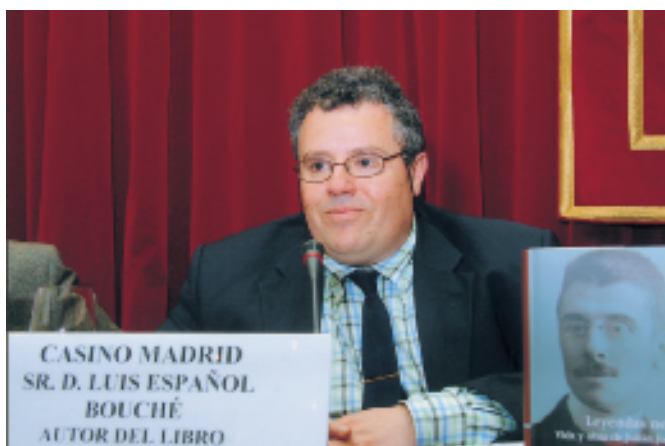
El autor de “Leyendas Negras. Vida y obra de Julián Juderías”.