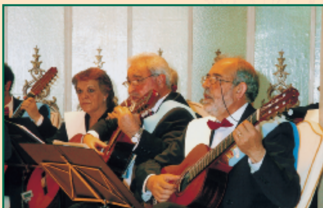
El programa ofrecido por la Agrupación Musical de Pulso y Púa 5º Traste, constituyó una combinación perfecta de lo clásico y lo popular.

Y si el juicio ha de hacerse por la cantidad y la emoción de los aplausos, no tengan la menor duda de que los augurios del Presidente se cumplieron con