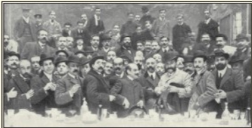
Banquete celebrado el 15 de febrero de 1907; imagen publicada en "El Arte del Teatro"