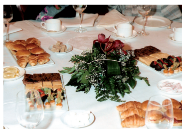
Tertulia de Señoras Socias en torno a un exquisito té.

A partir del lunes 6 de octubre, las señoras Asociadas del Casino de Madrid ya saben que cuentan con una nueva cita los primeros lunes de cada mes. Un encuentro para la distracción, la amistad y también para el paladar, con el sabroso Te que se puede degustar acompañando siempre de delicias para disfrutar en buena compañía y estupenda música. En algunas ocasiones, también las damas casinistas tendrán gratas sorpresas con las que no contaban, algún detalle inesperado que siempre agradecen. Otras será un desfile con las últimas tendencias en moda, peluquería, maquillaje, o complementos variados que nunca viene mal, para tener otros puntos de referencia.