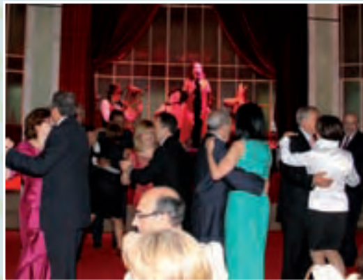
Muchos fueron los socios que se animaron a bailar las melodías de “Cosmopolitan Cabaret”.