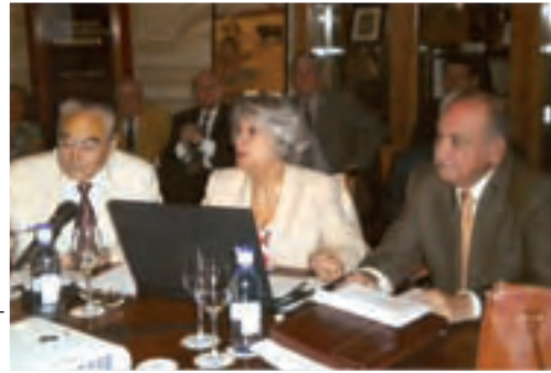
A la izquierda, Tertulia Taurina. Arriba, Tertulia Literaria Natalio Rivas.