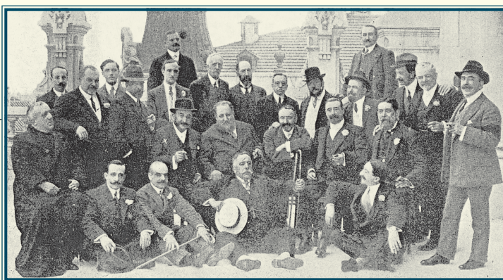
El homenajado con algunos amigos y admiradores.

La imagen, obra de Compañy, fue tomada en la terraza del edificio casinista de la calle Alcalá, inaugurado unos meses antes.