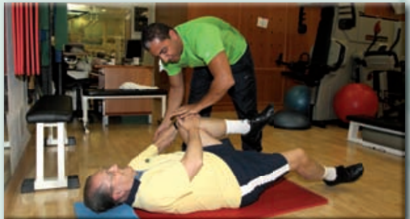
Casino de Madrid