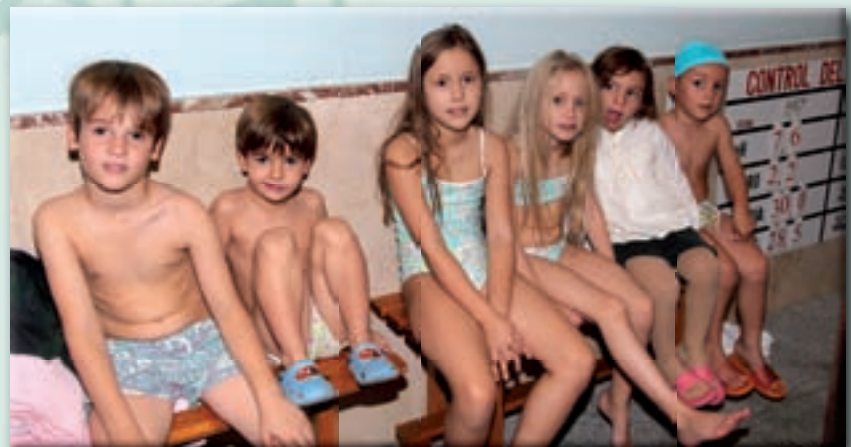
Casino de Madrid

Los más pequeños de la casa, acuden al Casino los sábados por la mañana para recibir sus clases de natación.