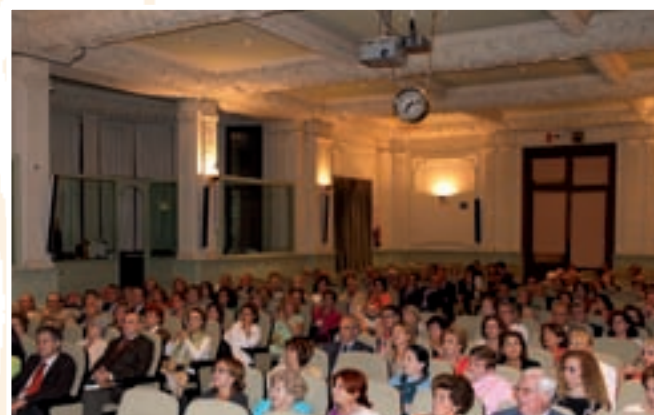
Los socios abarrotaron, una vez más, el Salón Príncipe del Casino de Madrid para escuchar a José Luis Garcí y sus acompañantes.